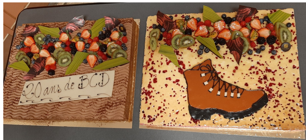
21 mars 2024 - 20 ans de BCD

Randonnées & Sorties culturelles 2 ème trimestre 2024